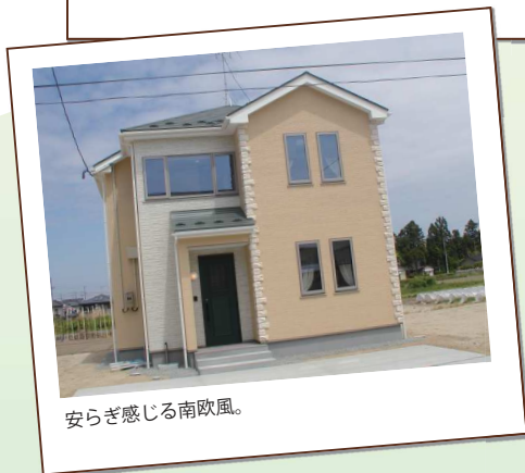
安らぎ感じる南欧風。