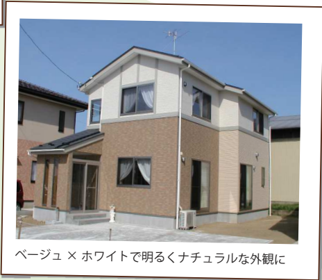
ベージュ×ホワイトで明るくナチュラルな外観に