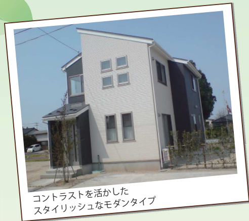
コントラストを活かした スタイリッシュなモダンタイプ