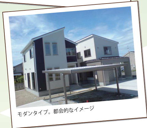
モダンタイプ。都会的なイメージ